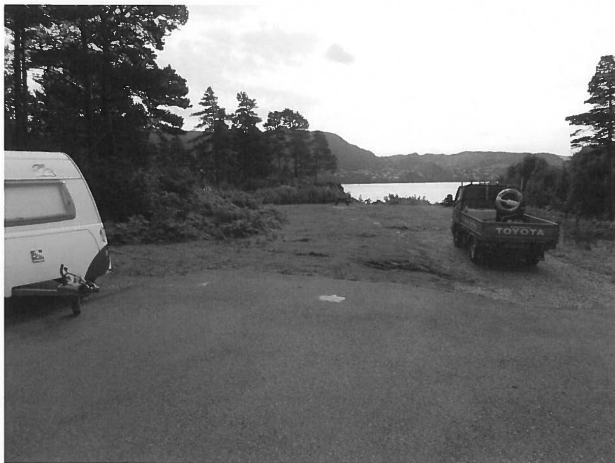
Bilete 2: Opprinneleg areal (bilete teke 2017). Biletet syner at det har føregått ei viss bilkøyring på arealet.