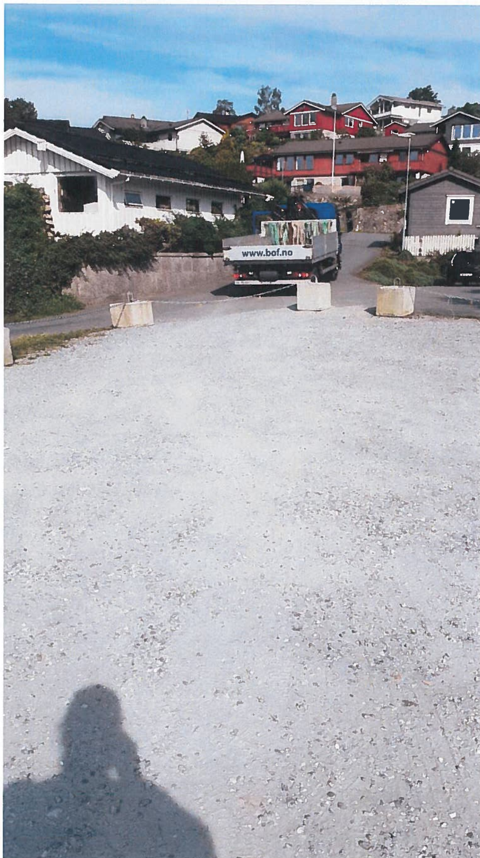
Bilete 4: Avstengd areal (2021).