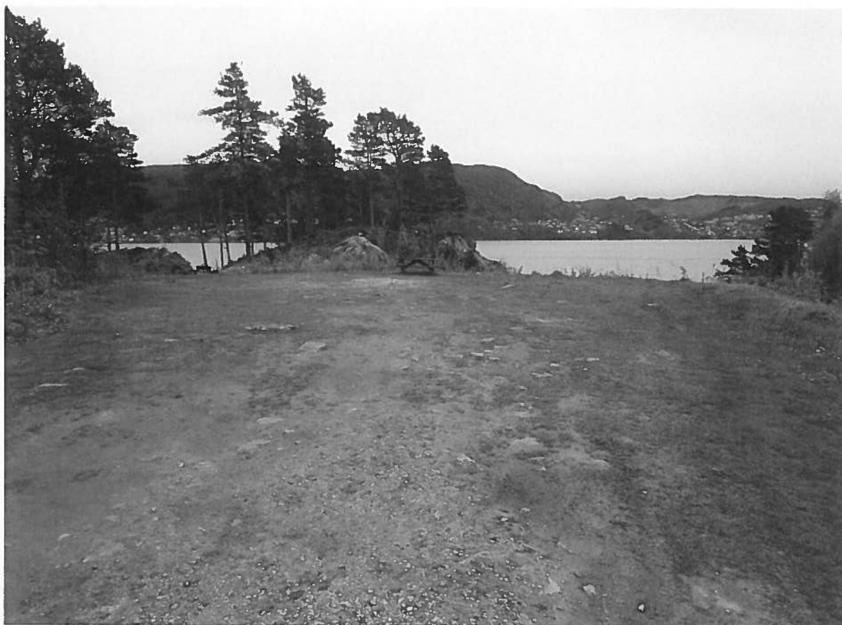
Bilete 3 : Opprinneleg areal (bilete teke 2019). Biletet syner at bilkøyninga på arealet er tilteke, då det har vorte tydelege og store flekker i grasmarka.