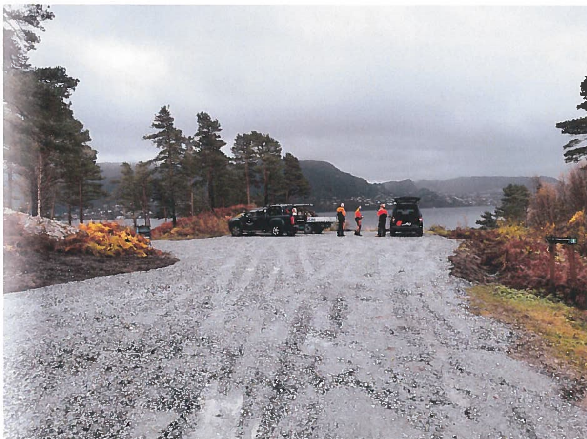
Bilete 1: Oppgrusa areal (bilete teke hausten 2019, kort tid etter arbeidet blei utført).