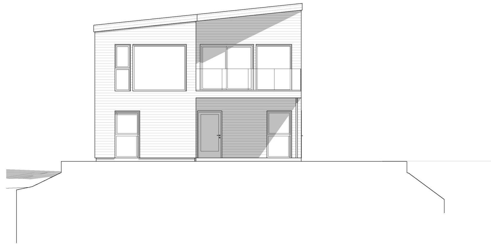
1:100 Fasade Sør-Vest