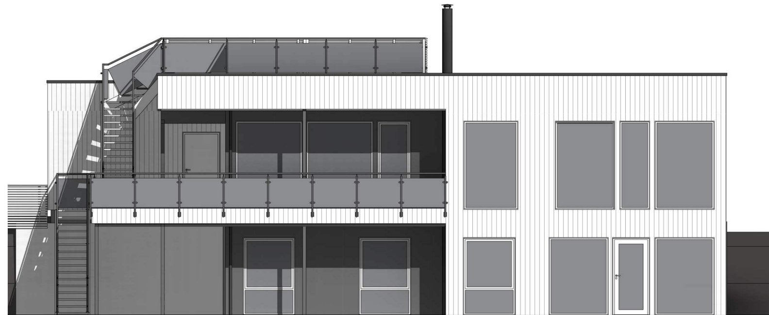
sørvest 1 : 100