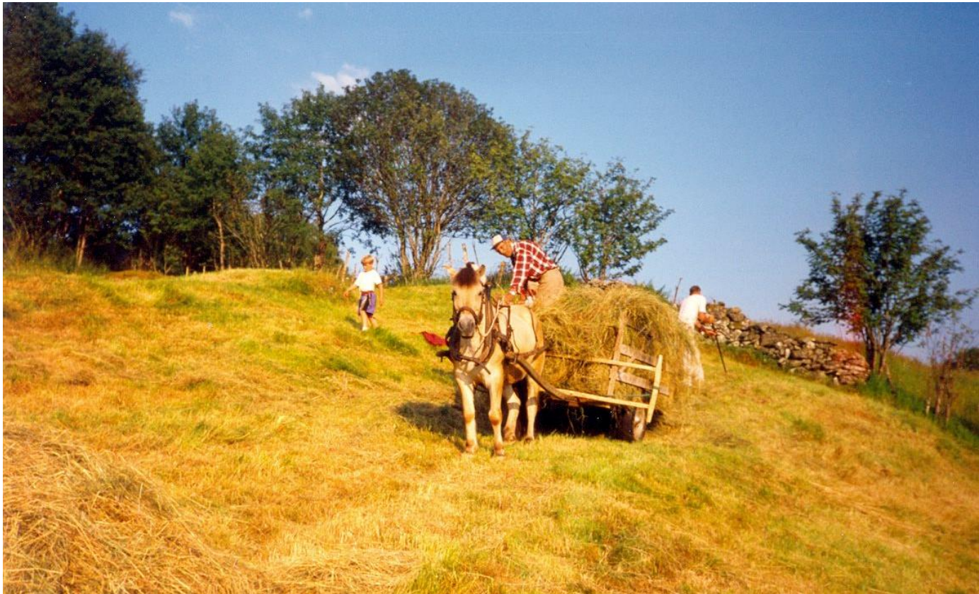
NORDA STYKKET: Slåtteteigen i Norda stykket hadde eit høgt artsmangfald av blomstrande plantar jamnt fordelt i enga. Bilde er frå høyslåttan ein gong på 1980-talet, då hesten framleis var den viktigaste kraftkjelda på somme bruk.