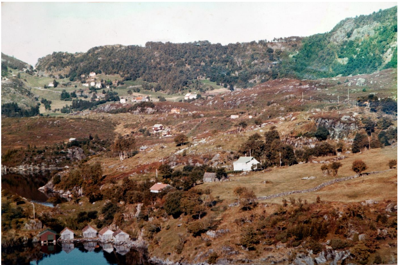
SELLEVOLL: I minst eit par hundre år har vegen til Trossevikje vore viktig og nyttig. Flyfotoet (bildet) over Sellevoll er frå tidleg på 1960-talet med Litleskare i bakgrunnen. Naustrekka nede til venstre er Trossevika, og bak ser ein Lammevågen.

I 1936 og 1937 fekk dei nødsarbeid på Sellevoll for å utbetre den gamle sjøvegen. Vegen som ved utskiftninga i 1880 hadde gått over Balane eigna seg dårleg som køyreveg etterkvart som utviklinga gjekk framover, og fleire av bruka hadde behov for betre tilkomst til inn -og utmarksteigane sine. Det vart difor ei utskiftning på vegen som førte til at den "nye" vegen vart lagt aust for Balhaugen og ned langs hovedgrøfta ovanfor dalføret. Den «nye» sjøvegen vart ei god løysing for bøndene på Sellevoll. Vegen, som var i god forfatning, har med åra kollapsa fleire stader. Til dels på grunn av tidas tann, men også på grunn av høg vassføring og flaum som følge av tette grøfter. (kjelde: Ove Walle )