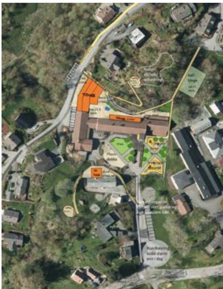
Figur 2: Skisse for utvikling av uteareal. Denne er lagt til grunn ved utrekning av framtidige overvassmengder

Den planlagde utbygginga av Manger skule vil ha lite innverknad på overvassmengdene. Dersom ein legg Figur 2 til grunn, vert det litt fleire tette flater som følgje av tak på tilbygg på skule og parkeringsplass, samtidig som endring av skuleplassen truleg vil medføre høgare infiltrasjon der. Grensene mellom felt 1 og 2 på nordsida av skulen endrar seg truleg dersom vestfløyen vert utvida. Sidan utforminga på dette foreløpig er usikkert, er det ikkje teke høgde for endra feltgrenser. Felt 3-6 endrar seg ikkje som følgje av planlagd utbygging. Det som utgjer størst endring i avrenninga er derfor klimafaktoren.