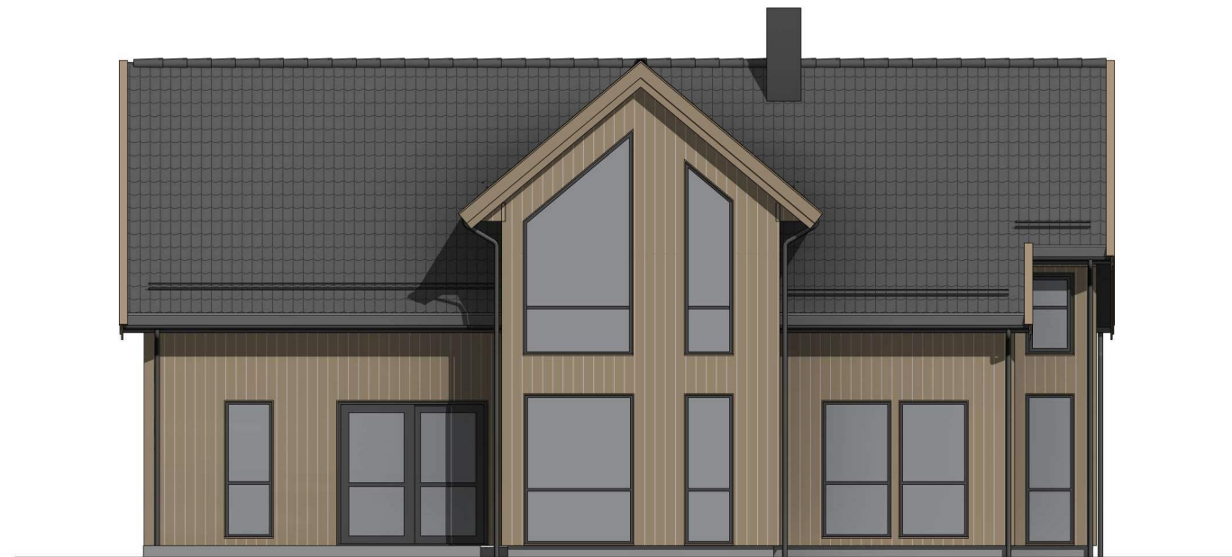
øno 1 : 100