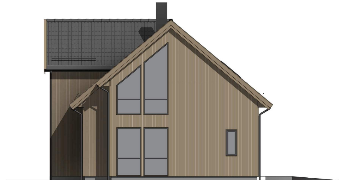
nnv 1 : 100