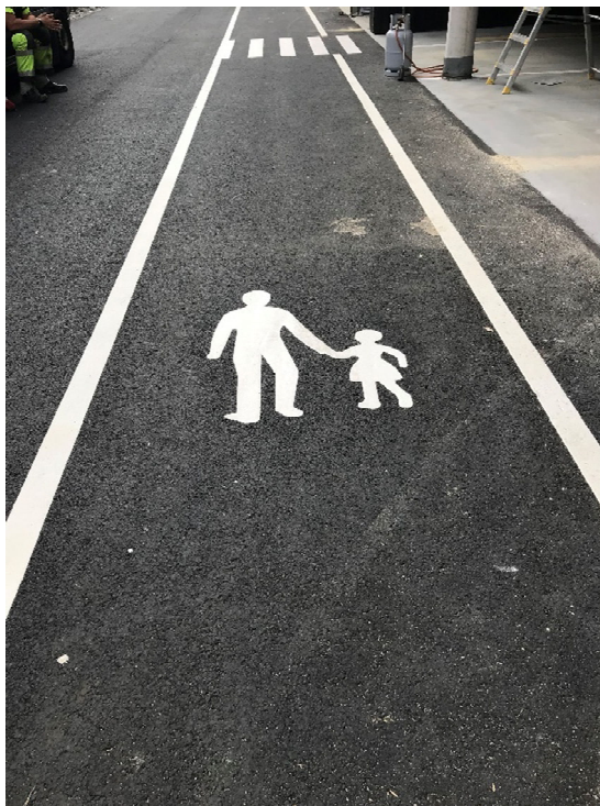
Merking av gangfelt på baksiden av byggene

Ansvarlig søker har befart byggeplass i dag sammen med prosjektleder, og angitt arbeid er på det nærmeste ferdigstilt. Ved befaringen i formiddag gjenstod deler av oppmerkingen på oppsiden av byggene, men dette skulle ferdigstilles i.a. dagen. Montering av glassrekkverk er ferdig, men under montering ble dessverre noen av glassfeltene knust. Disse områdene er midlertidig sikret med plater. Nye ruter er bestilt, og vil bli montert så snart de blir levert på byggeplass (se bilder under). Ellers gjenstår mindre kosmetisk arbeid, samt generell rydding av byggeplass.