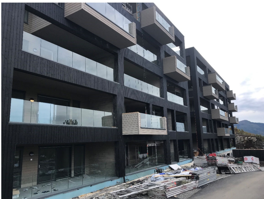
Glassrekkverk på balkonger og terrasser