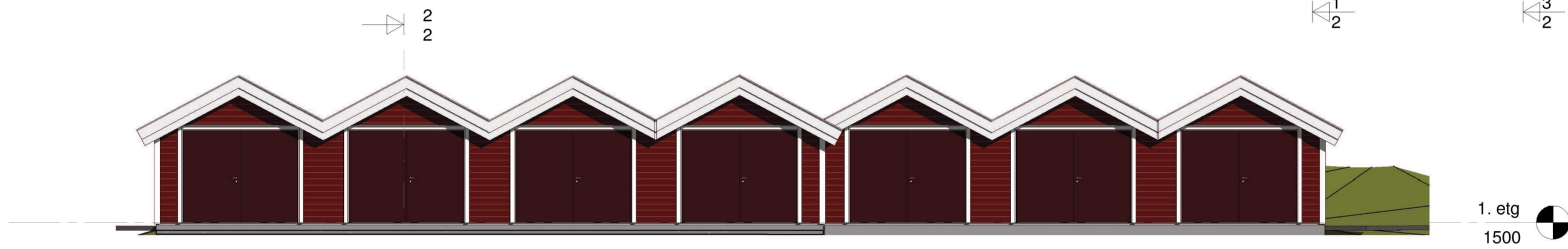
Fasade vest 1 : 100