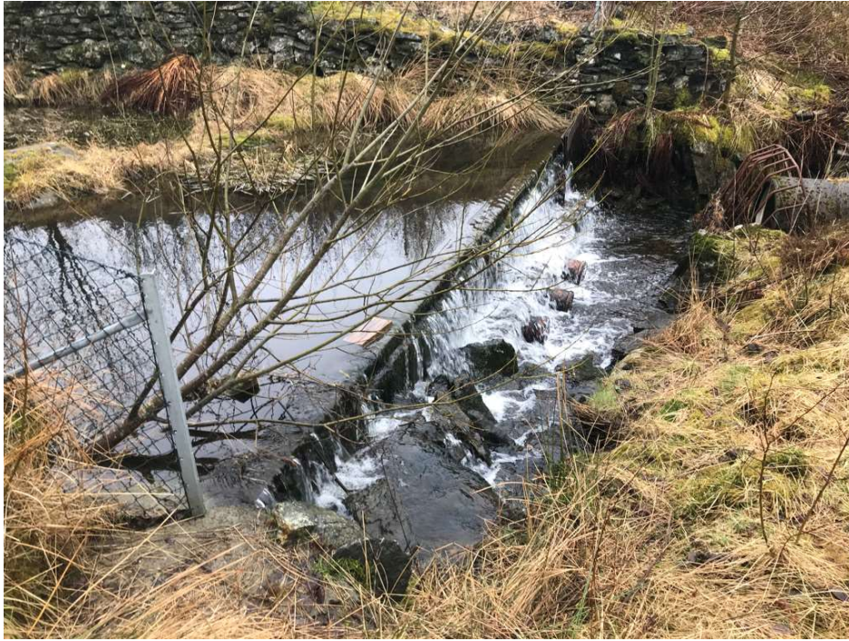
Bilde 3: Fangdam 3, 29.03.21

Fangdam 3 ligger et stykke nedstrøms Sveåsen, der Kloppedalsbekken går under fylkesveien. Fangdammen ble etablert ca i 2011 i forbindelse med utbygging av infrastruktur i Mjåtveitmarka. I følge Mjåtveitelvas forening fungerer selve damkonstruksjonen, men fangdammen kan være underdimensjonert for perioder med mye nedbør.