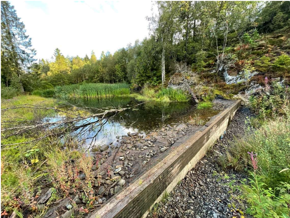
Bilde 1: Fangdam 2, 25.08.21.