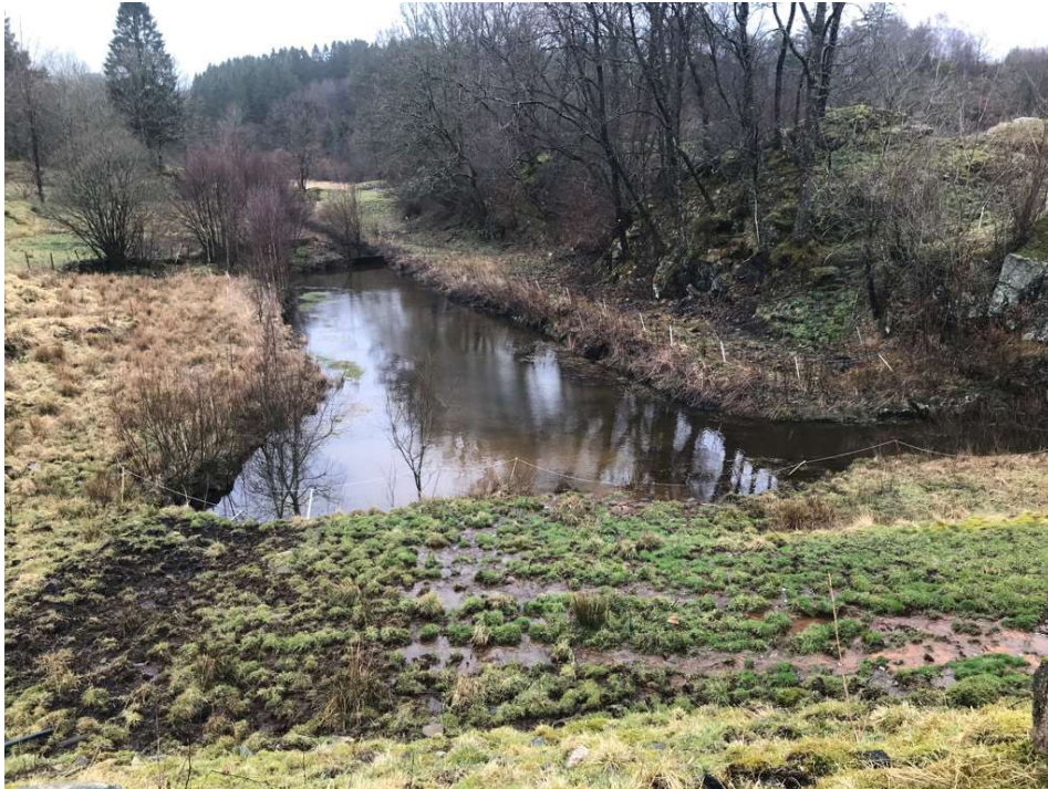
Bilde 4: Fangdam 4, 29.03.21

Fangdam 4 er den siste fangdammen før Kloppedalsbekken renner ut i Mjåtveitelva. Fangdammen ble i sin tid bygget i forbindelse med etablering av en jordtipp langs Kloppedalsbekken.