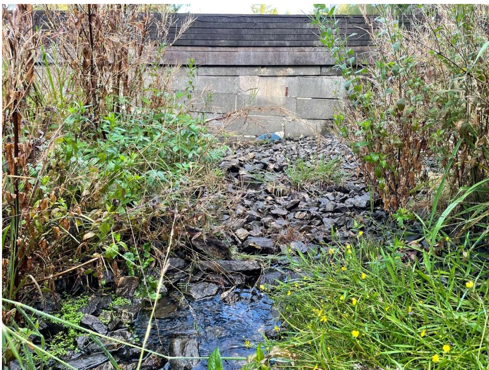
Bilde 2: Fangdam 2, 25.08.21. Nederst på bilde ser man vann som kommer ut under damkonstruksjonen.