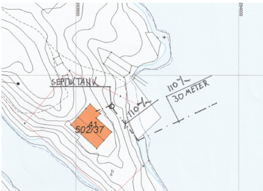
Figur 2 syner lokaliseringa av det omsøkte tiltaket på eigdommen 502/37.