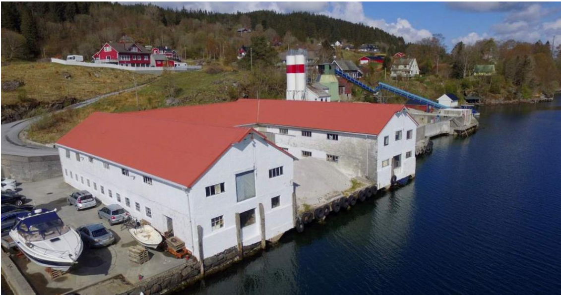
Bruknapp betong. Drone bilete.