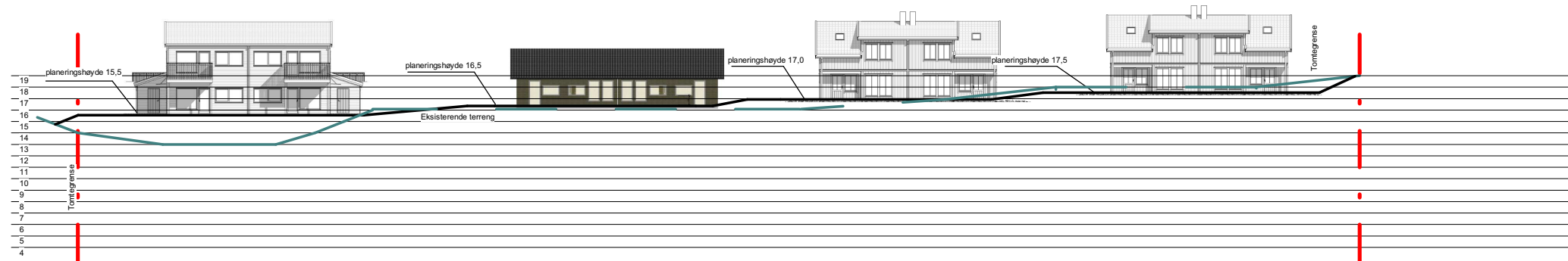
1 E1 1 : 500