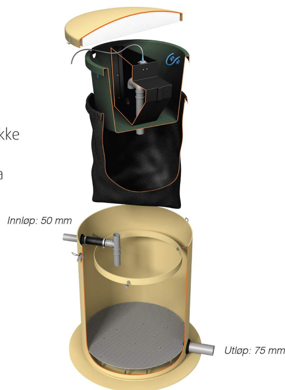
Vera Slamfilter for gråvann uten pumpe Varmekabel er ekstrautstyr.