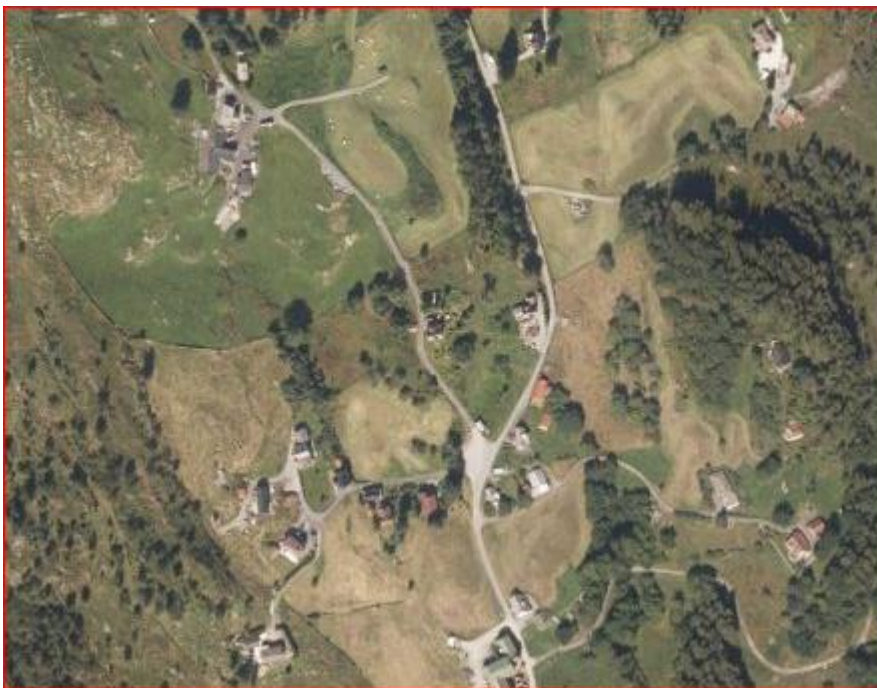
Figur 2 Ortofotofoto 2020

Søkjar sin argumentasjon for at det skal gjevast dispensasjon: