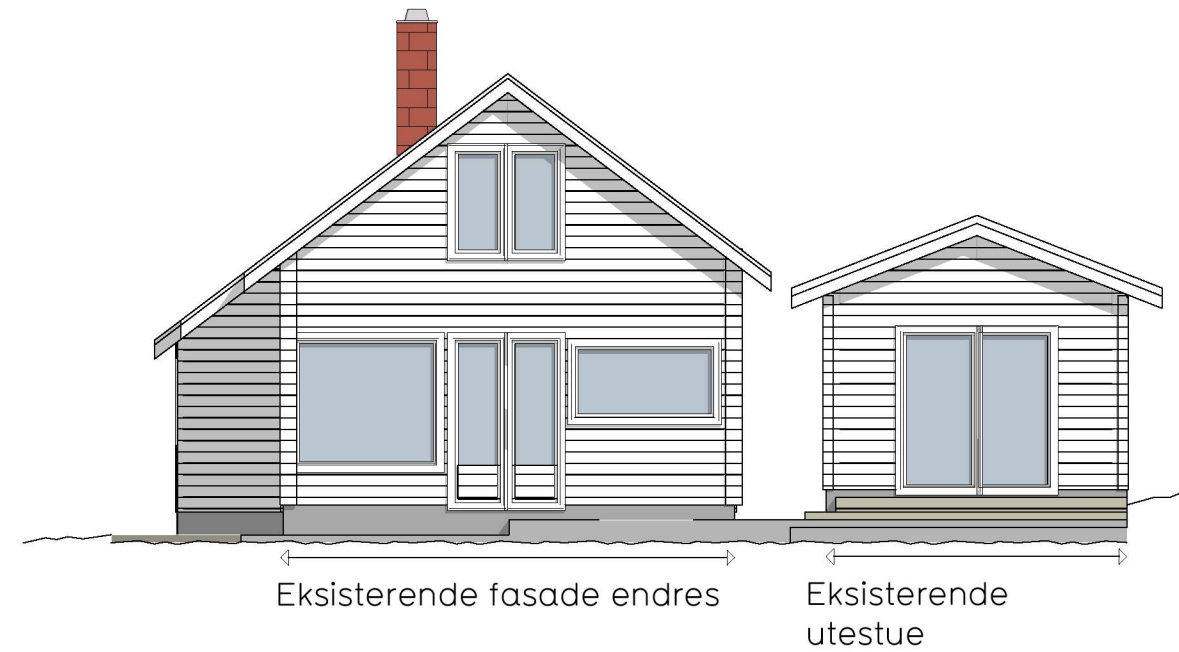
Fasade Sør vest