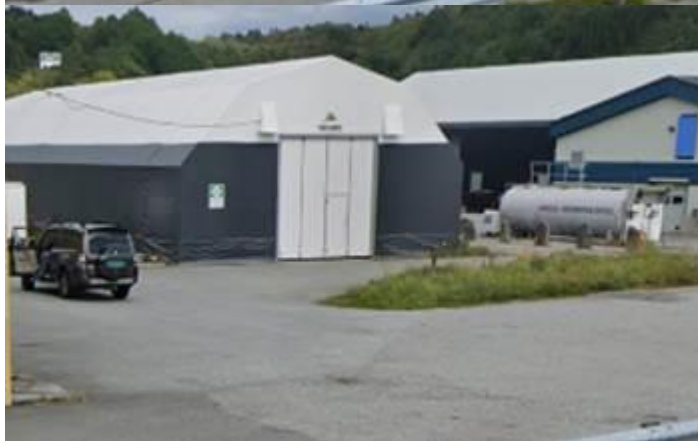
T.v. Gamal rubbhall – google street view 2009