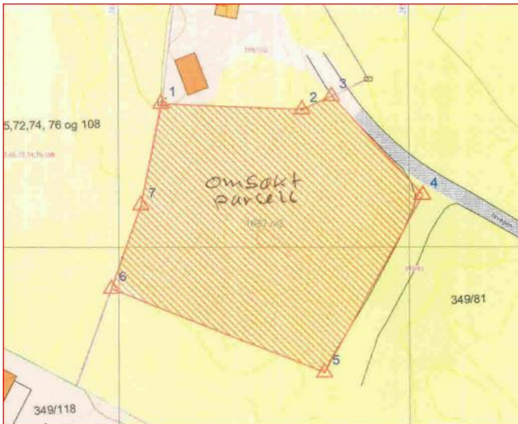
Figur 1 Frå situasjonskartet.

Det er søkt om dispensasjon frå arealdelen i KDP for frådeling av bustadtomt og bygging av bustad i LNF området.