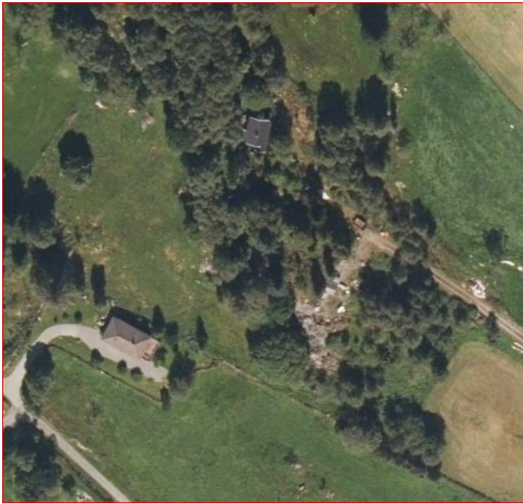
Figur 3 Ortofoto 2020