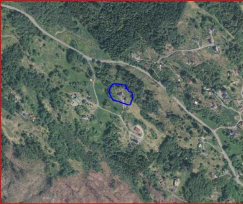
Oversikt. Ortofoto 2020.