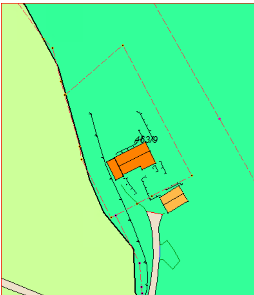
Utsnitt av kommunedelplan for Radøy

Eigedomen ligg i uregulert område innanfor det som i kommunedelplanen sin arealdel er definert som LNF-føremål for spreidd bustad, framtidig.