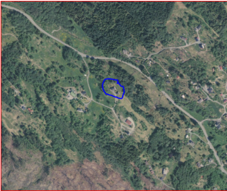
Oversikt. Ortofoto 2020.