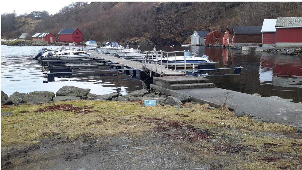
Flytebryggen som den fremstår i dag.