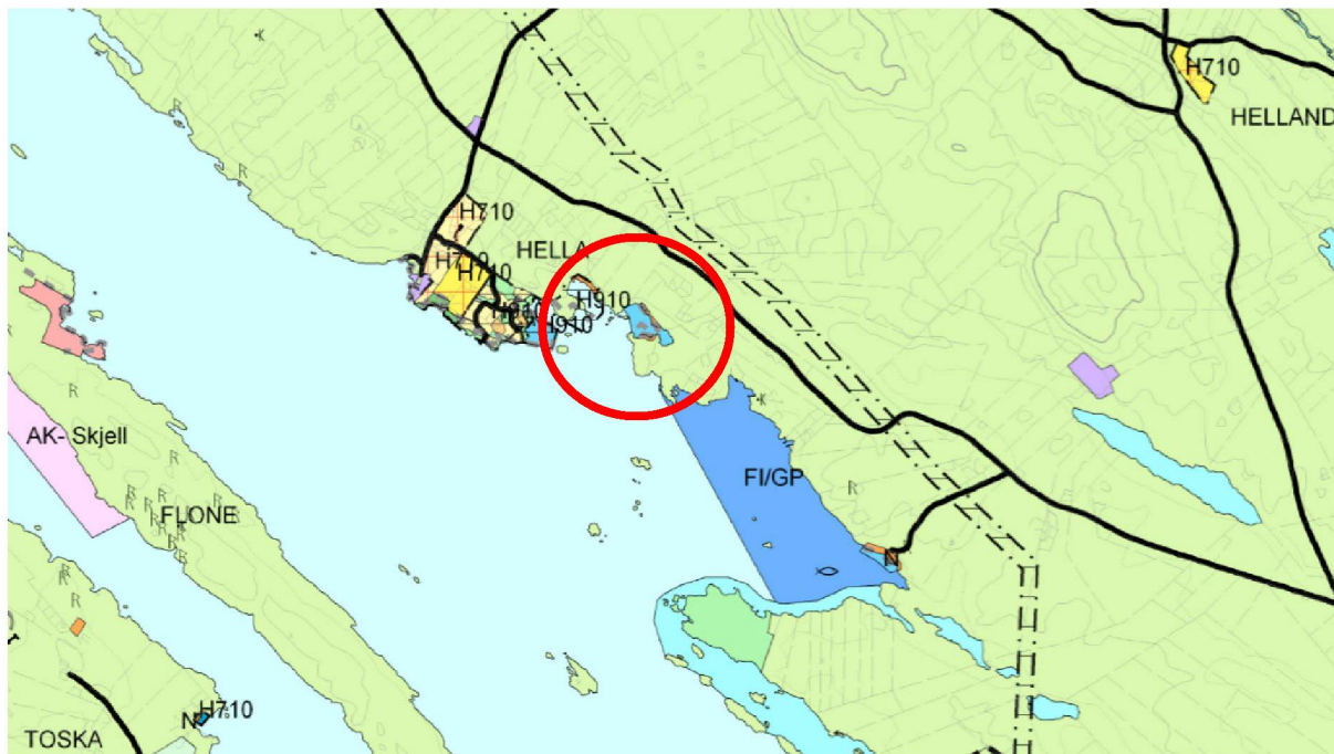
Utsnitt av Kommuneplan for Radøy. Det er vist en rød sirkel rundt Skuthamna.

Ifølge kommuneplan for Radøy 2011-2023 delrevisjon 2019, er området avsatt til Småbåthavn. Området er ikke detaljregulert.