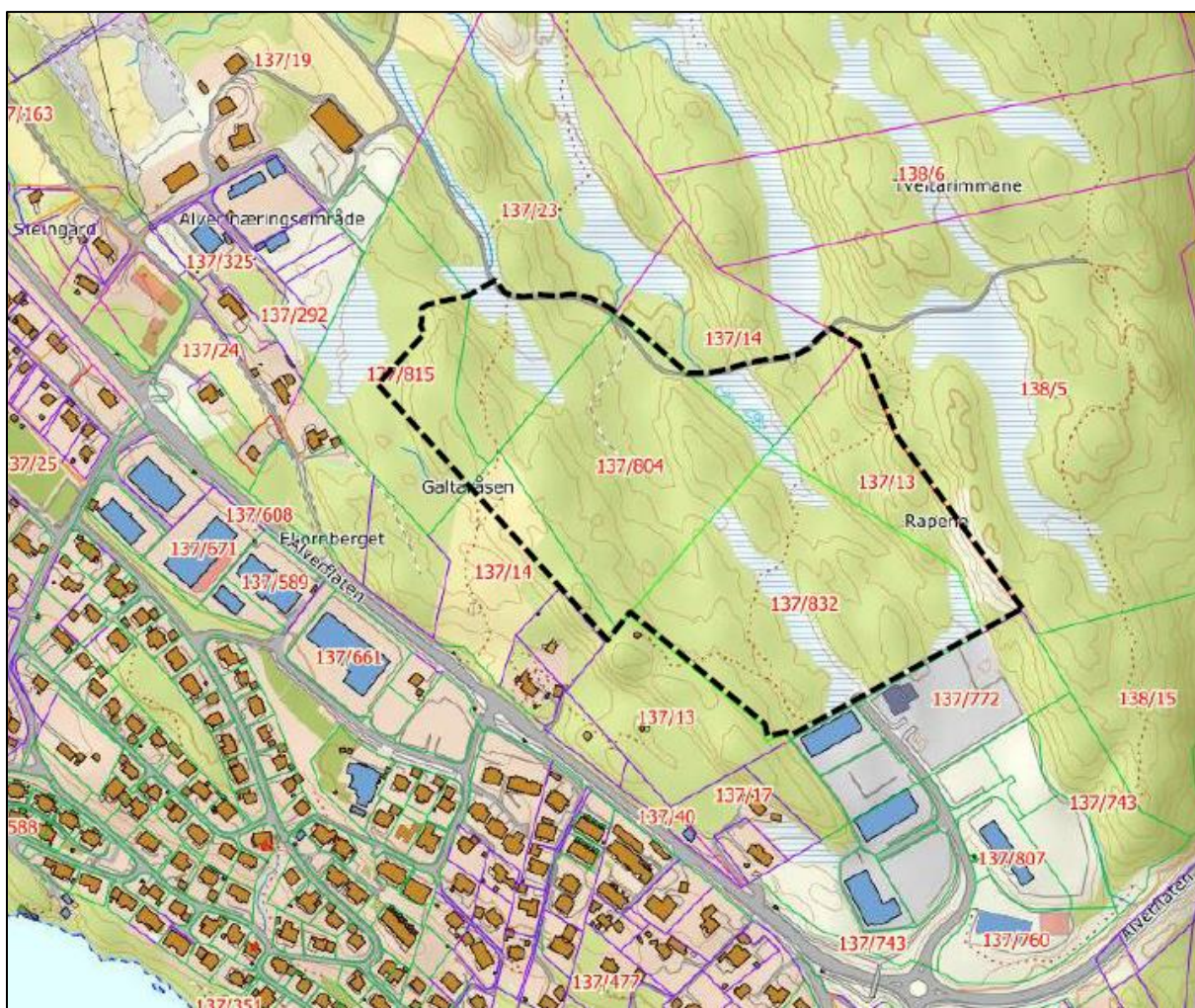
Figur 1. Kart over foreslått planavgrensing.

Forslag til planavgrensing er markert i kartet under og tilsvaer omtrentleg 138 daa ( figur 1 ). Grunnen til at planavgrensinga ikkje berre omfattar arealet avsett til næring kommuneplanen (sjå figur 3 ), men også noko LNF areal, er for at ein skal å ha moglegheit til å sjå på ei omdisponering av desse areala, eksempelvis å flytte noko om på desse. Det er også teke med ein del LNF areal mot nord. Dette er gjort slik at ein har moglegheit til å flytte myrareal frå planområde dit om dette skulle vise seg å bli aktuelt å gjere.