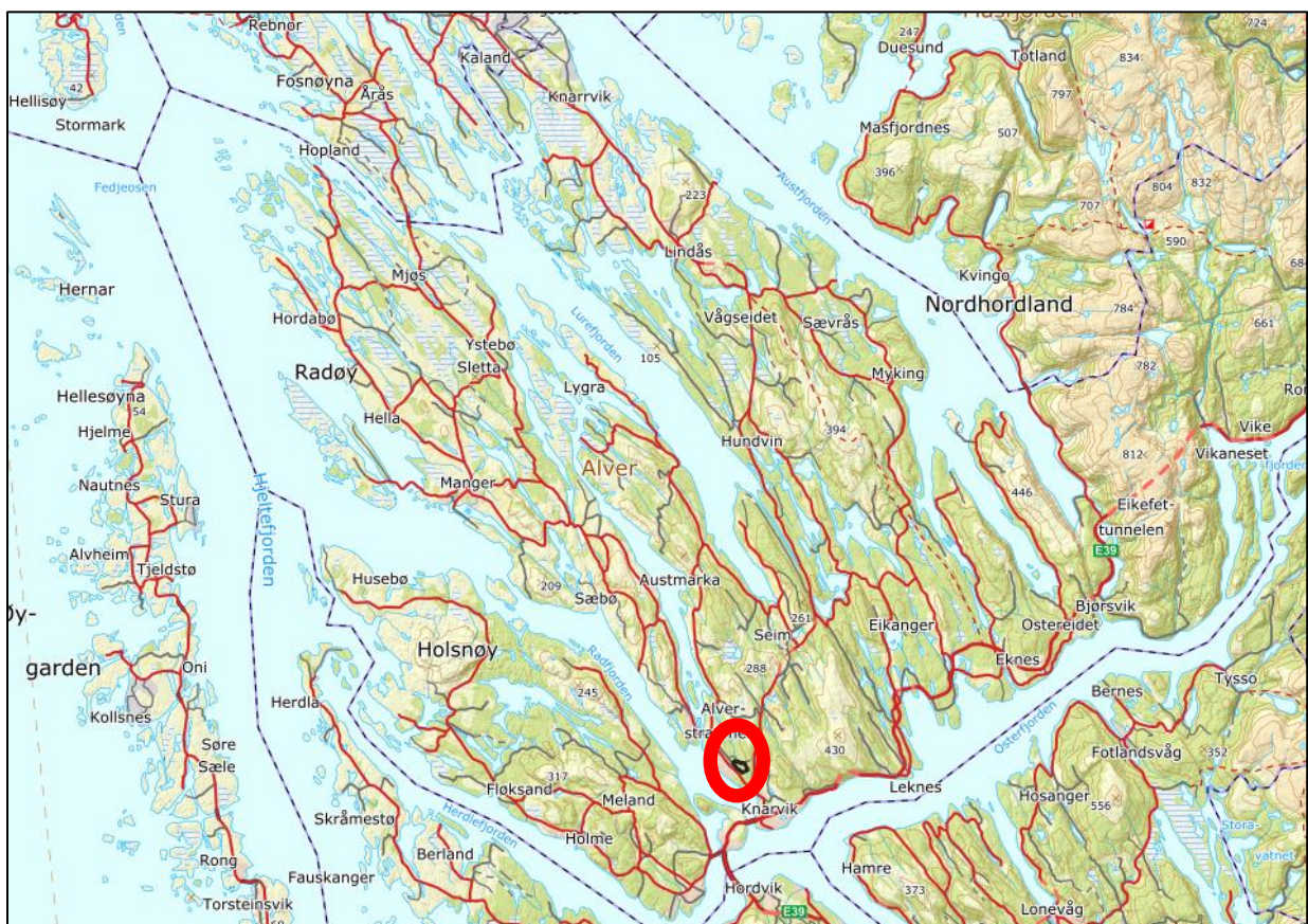
Figur 2. Planområdets omtrentlege plassering i kommunen (raud sirkel)

Planområdet ligg sør i Alver kommune, ca. 1 km nord for Isdalstø, 3 km nord for Knarvik og 2 km sør for Alversund ( figur 2 ).