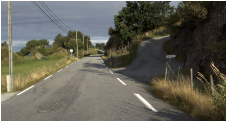
Fig: Vegbilete 2020.

Det vil i praksis ikkje vere behov for søknad om endra bruk av avkøyrsløve til bnr. 2. Basert på vurdering av kart, flyfoto og gatebilete er avkøyrsløveforholda til bnr 2 ikkje tilfredsstillande i dag. Vi meiner at tiltaket som er omsøkt vil medføre meir kryssing av fv, 525, og at det vil vere behov for gode avkøyrsløve som er godt synleg frå veg. Vi vil difor minne om at avkøyrsløve skal haldast vedlike, og vi oppmodar om å utbetre avkøyrsla slik at den får ei betre utforming. Aktuelle tiltak for å utbetre avkøyrsla er å gå inn i skjering slik at svingradius vert større og ein oppnår betre plassering og sikt i avkøyrsla. Ei slik utbetring vil vere søknadspliktig etter veglova. Vi vil og vise til føresegner i Kommunedelplan for Radøy § 2.3.1 som stiller krav til stigningsforhold i avkøyrsløve.