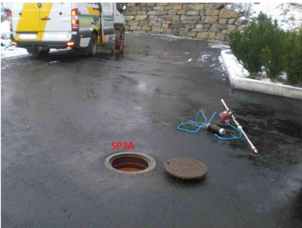
L26.11.2021 102917_SP3B_SP3A_261121_104141_10.jpg, 00:01:15, 6.36m Inspeksjon fullført / i SP3B