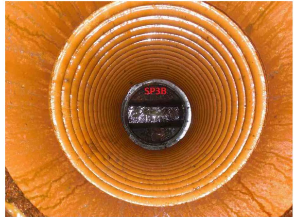
L26.11.2021 102917_SP3B_SP3A_261121_104141_9.jpg, 00:00:00, 0.00m Start inspeksjon / i SP3B