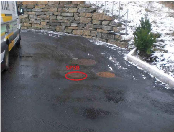
L26.11.2021 102917_SP3B_SP3A_261121_104141_8.jpg, 00:00:00, 0.00m Start inspeksjon / i SP3B