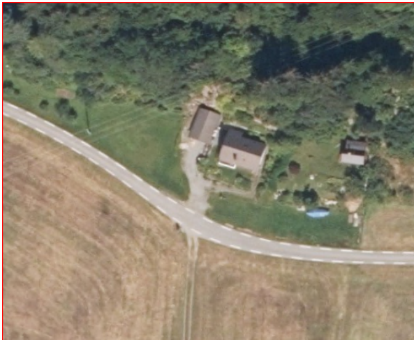
Figur 3 Ortofotofoto 2020