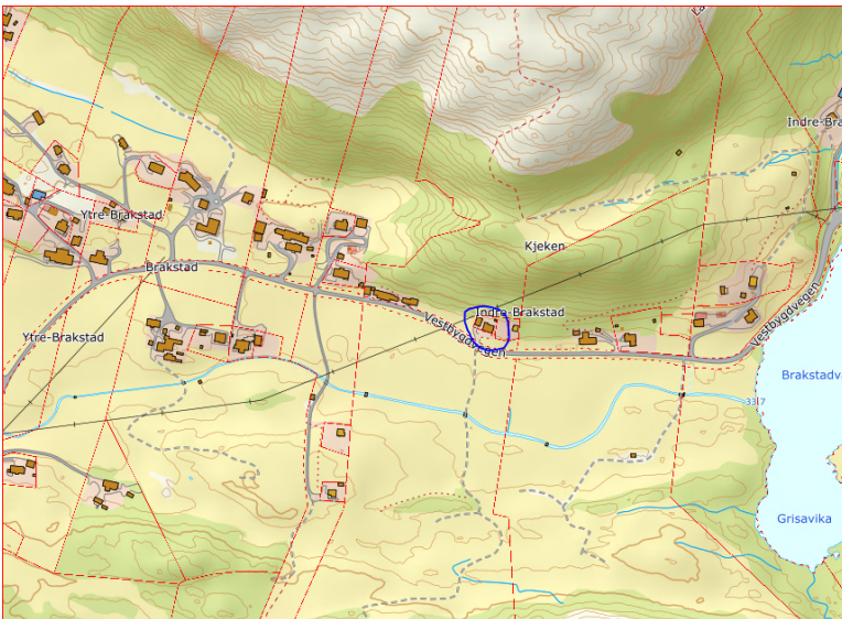
Figur 2 Oversiktskart. Blå ring syner plassering av tomt.