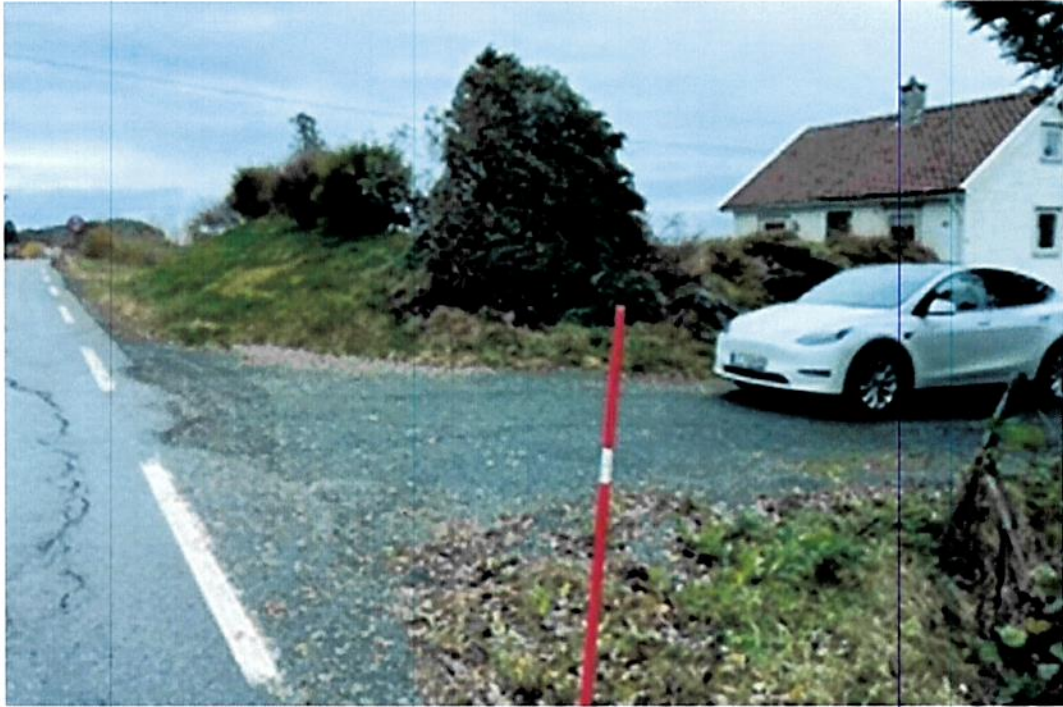
Figur 3 siktforhold ved avkjørsel