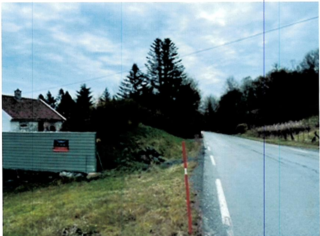
Figur 2 jordvoll sett fra fylkesveien

Under er det vist bilder av jordvoll og avkjørsel fra eiendom som også bekrefter at siktforhold ved avkjørsel til eiendom er tilfredsstillende.