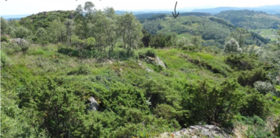
Figur 2 Punkt 2 Melandsåsen sett fra Nordnipa