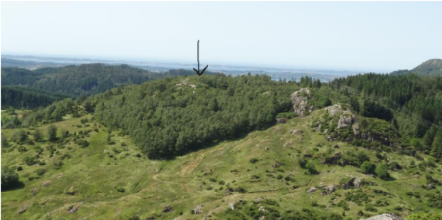
Figur 1 Punkt 1 Salbuklettet sett fra Nordnipa