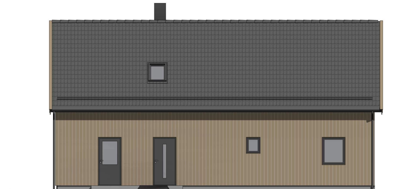
vsv 1 : 100