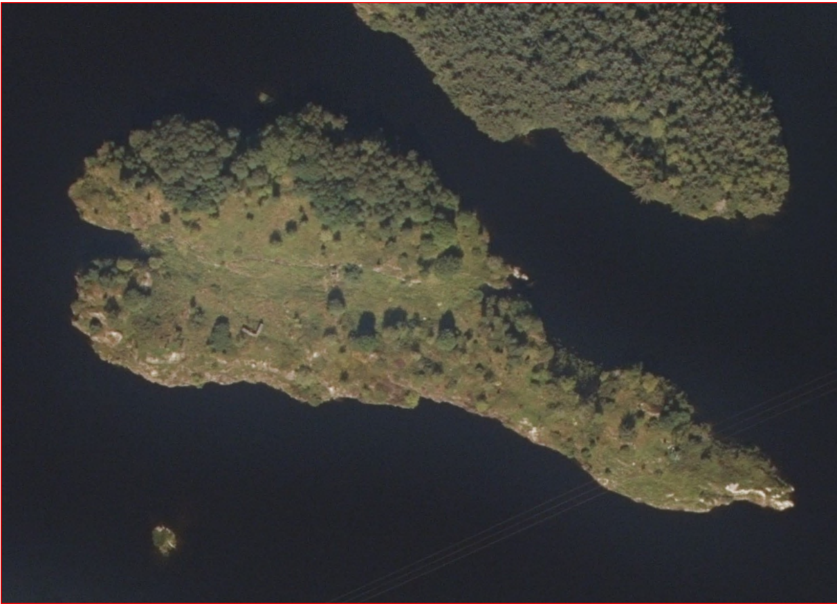
Figur 2 Ortofoto 2020

Sjå vedlagt søknad om oppretting av festetomt datert 02.09.2021.