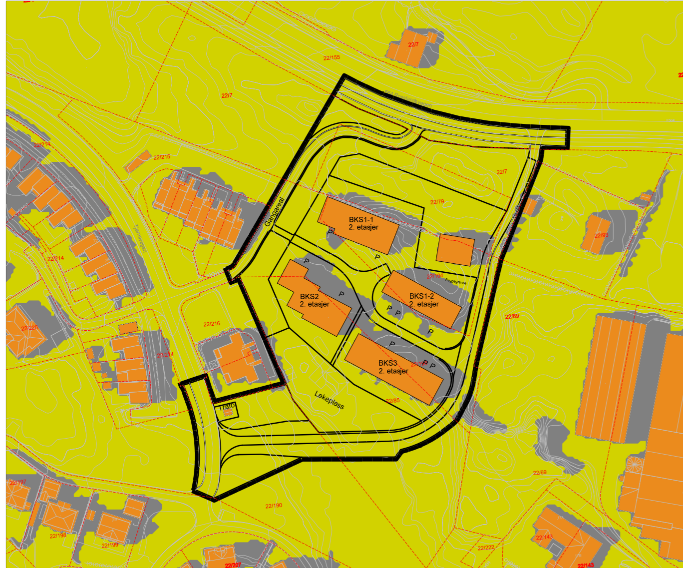
Planlagt situasjon 21. Juni Kl.18.00