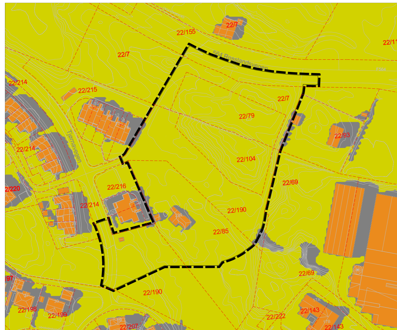
Eksisterende situasjon 21. Juni Kl.12.00