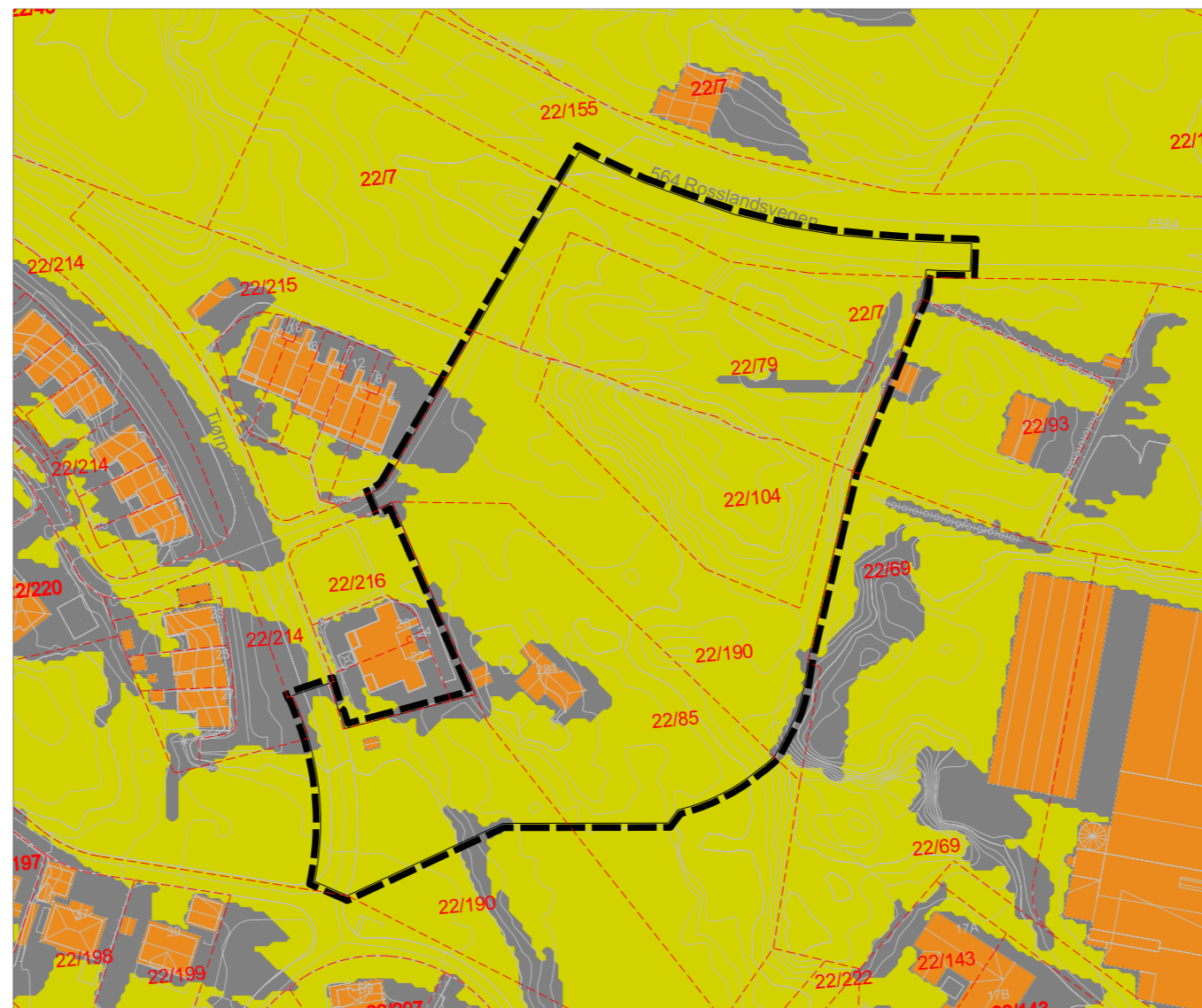
Eksisterende situasjon 21. Juni Kl.20.00