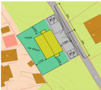
Fig 1. siktzone vist i søknad

Viser til førespurnad om uttale vedkommande Ett-trinns søknad med vedlegg mottek 31.12.2021. Det søkes om løyve til oppføring av vertikaldelt tomannsbustad og etablering av ny avkjørsle frå kommunal veg.