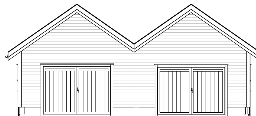
FASADE 2 1 : 100