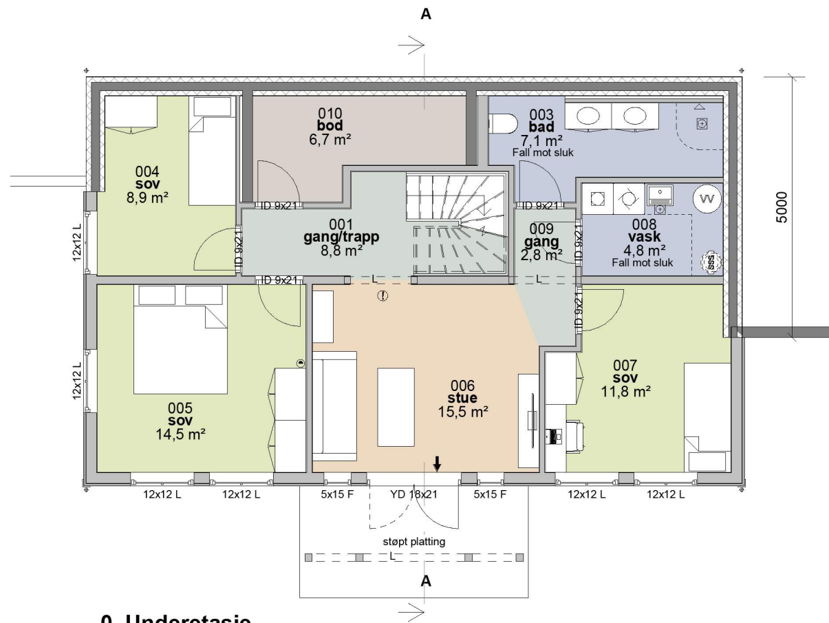
0. Underetasje 1 : 100