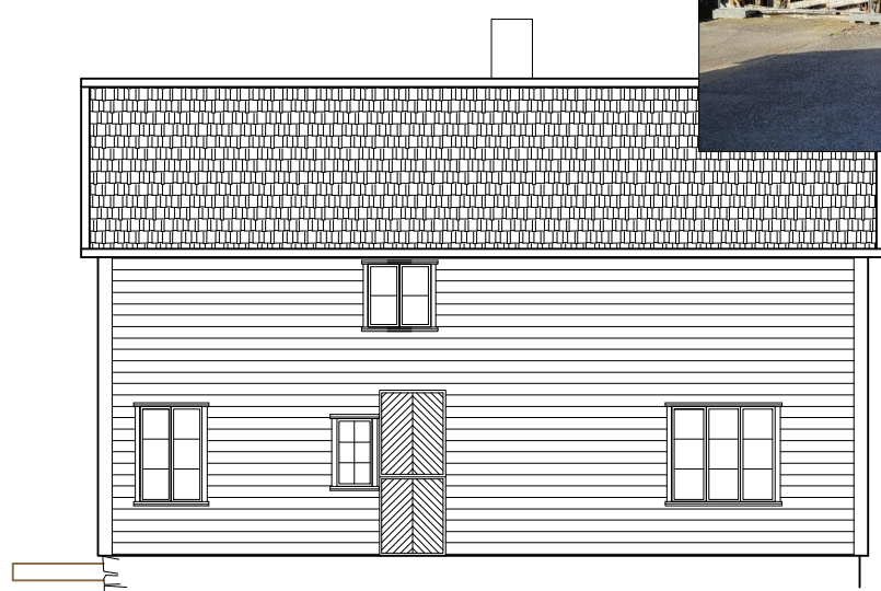
FASADE MOT SØR-ØST