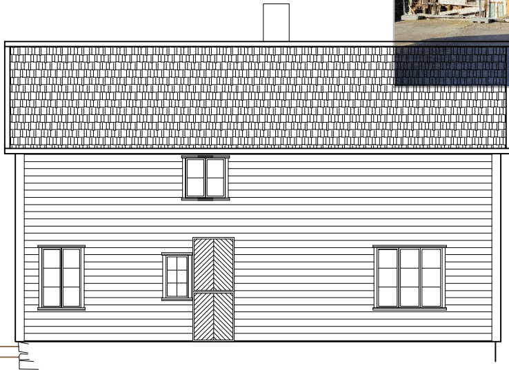
FASADE MOT SØR-ØST