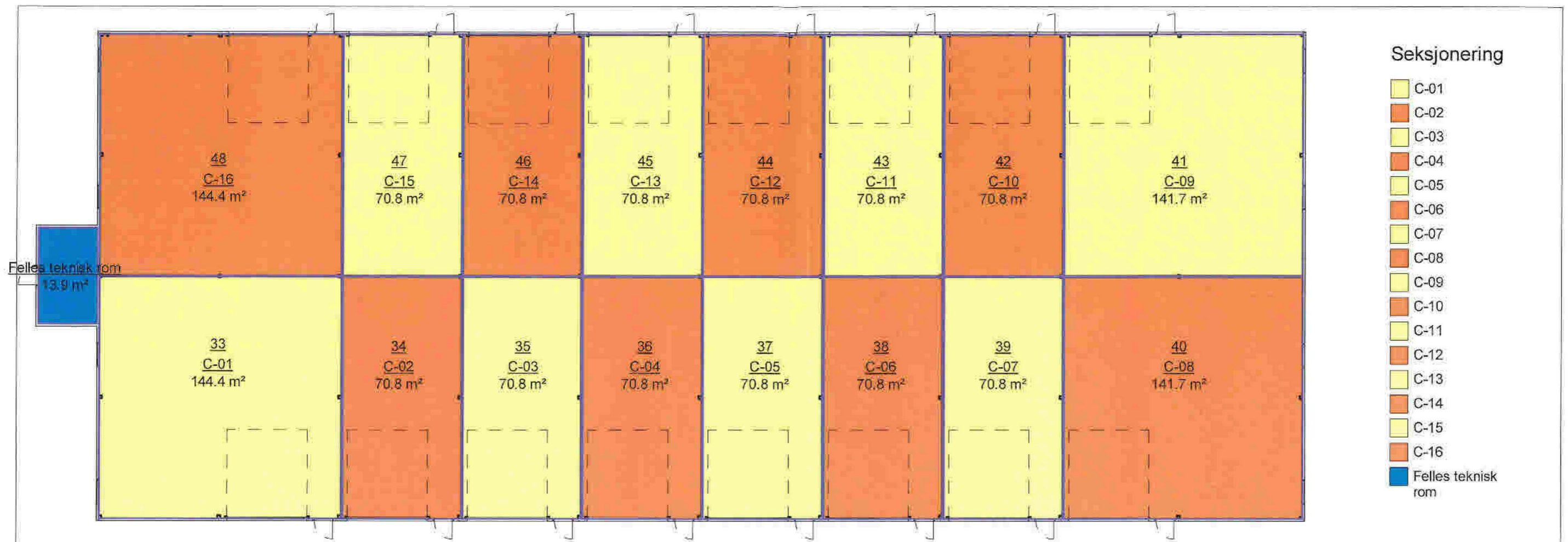
BYGG C - BRA pr. seksjon