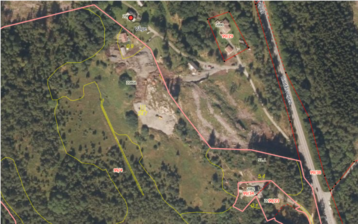
Figur 3 Flybilde av området

På flybilde viser det eit større terrengingrep som allereie er utført, denne saka er til behandling på avdeling for Miljø og tilsyn.