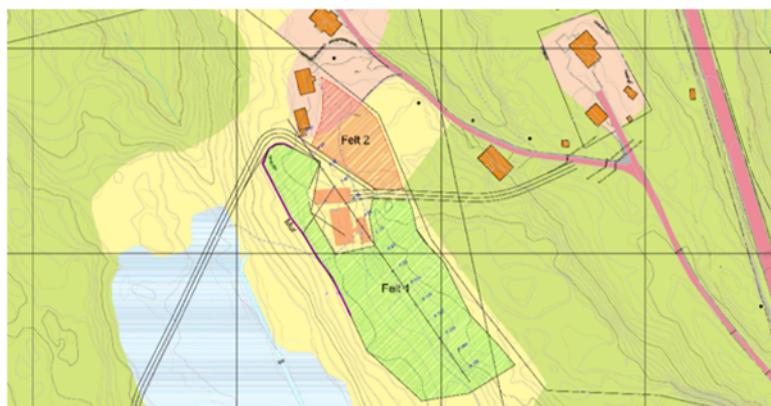
Figur 1 situasjonskart planlagt jordtipp/planeringfelt

Arealet skal fulldyrkast til lettbrukt fulldyrka jord gjennom terrengtilpasning, bortsprenging av ujamnheiter, planering og drening samt tilførsel av tilkjørte jordmassar. I praksis vil det vera naudsynt å fylla på minimum 1- 1,5 meter jord visst det er mineraljord og 2-3 meter om det er myrjord avhengig av synking. Grovt rekna må det tilførast ein stad mellom 15 -20 000 m 3 . Det er ikkje oppgitt kor massane skal koma frå anna enn at dei skal koma frå nærrområde.