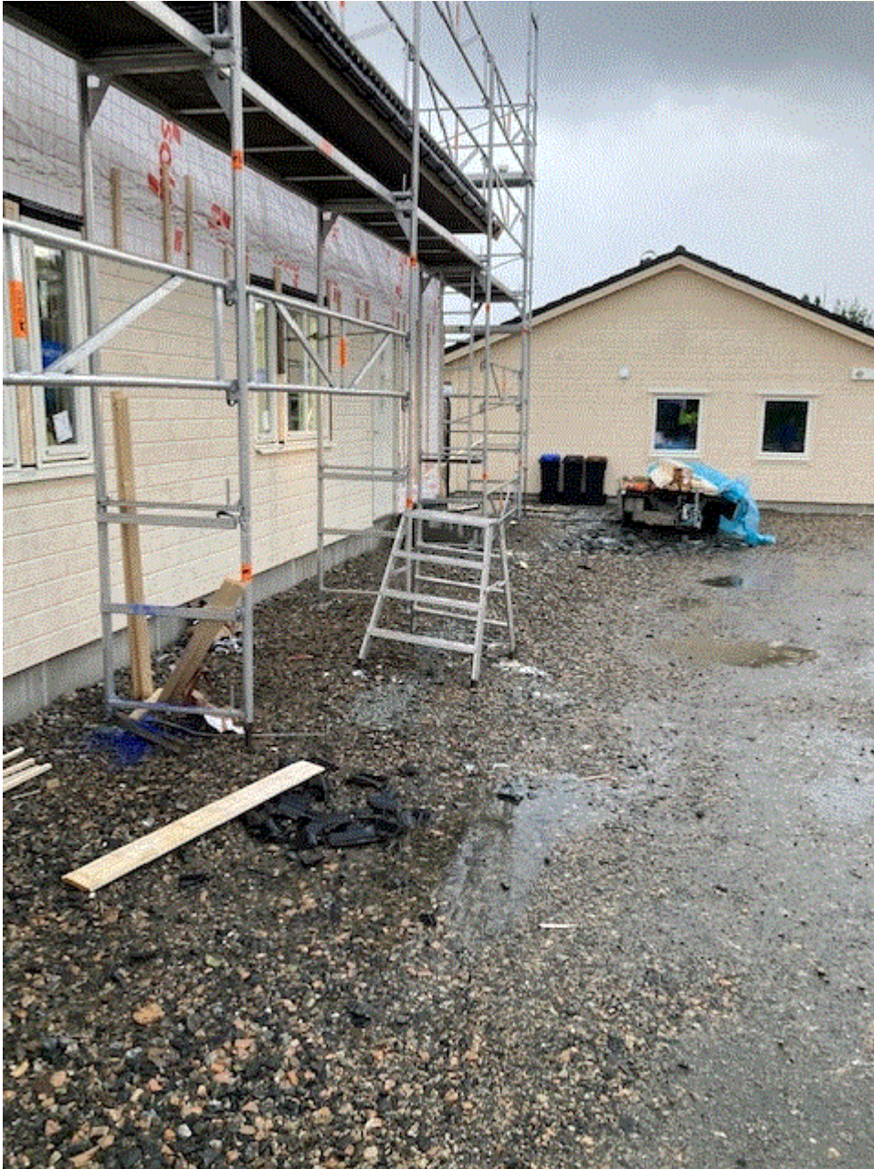
Sendt fra min iPhone