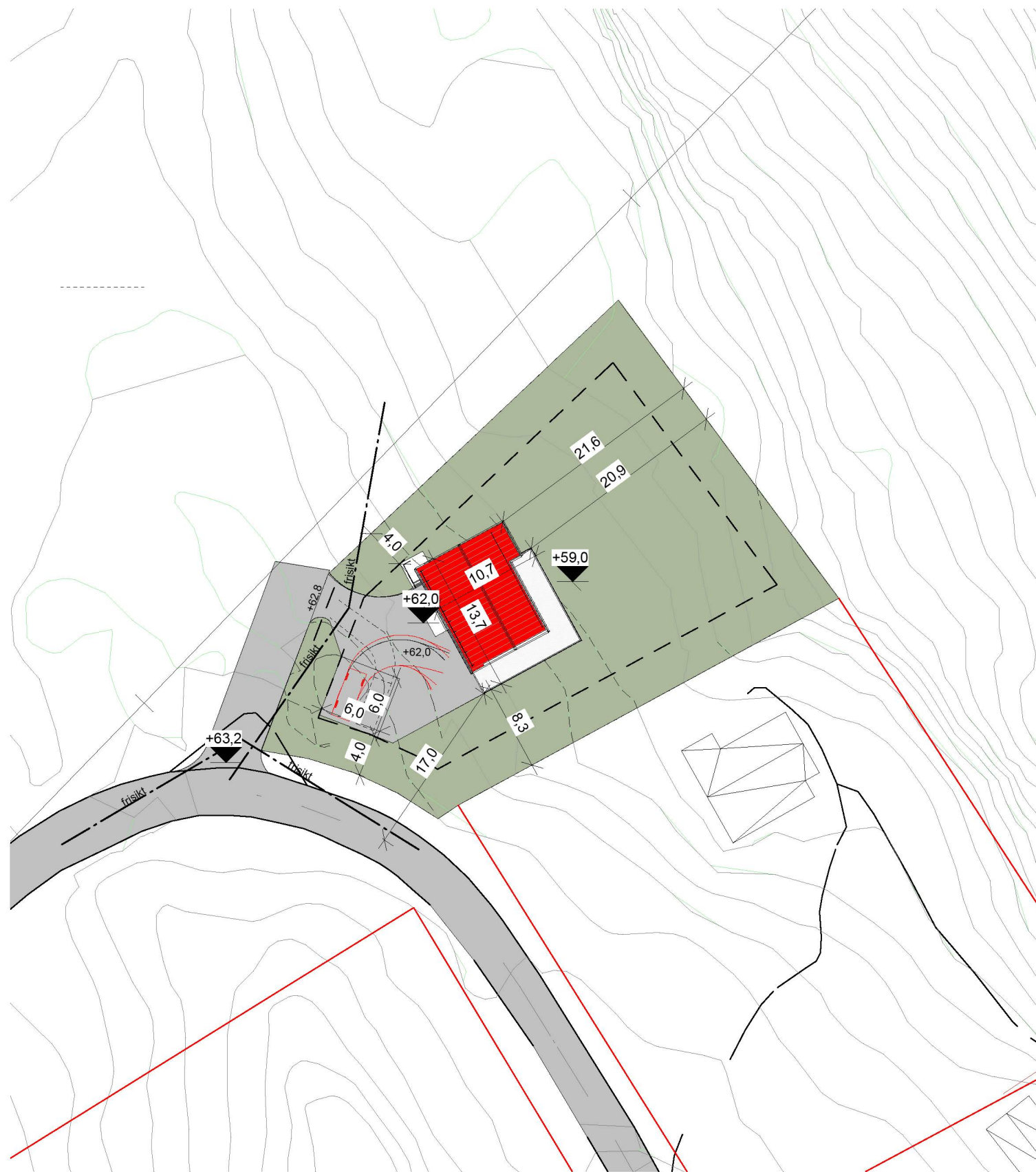
Situasjonsplan 1 : 500