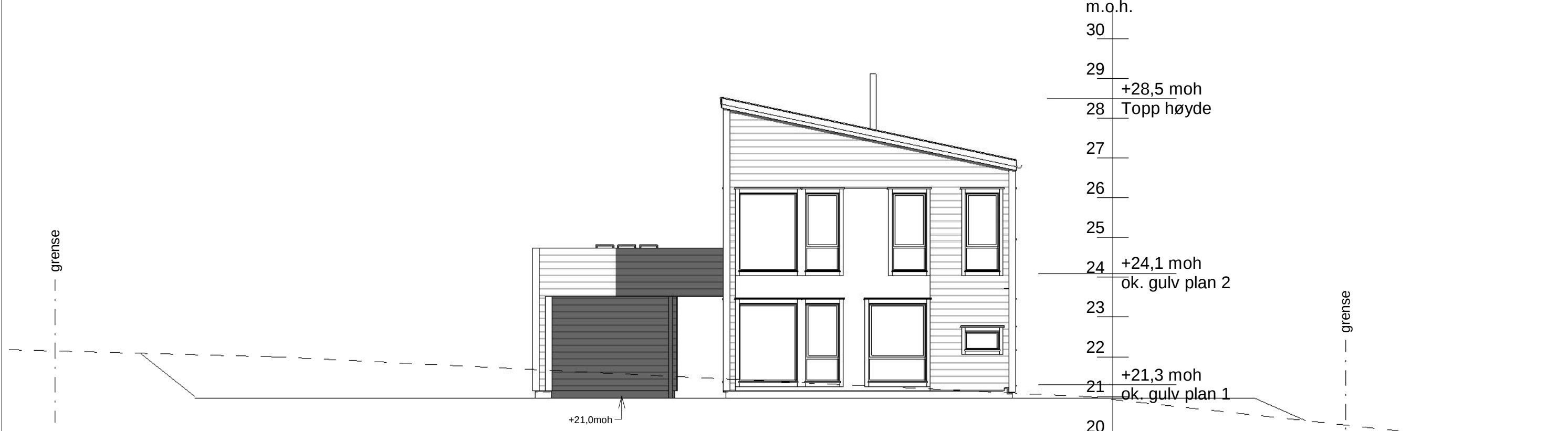
Fasade mot sør-øst