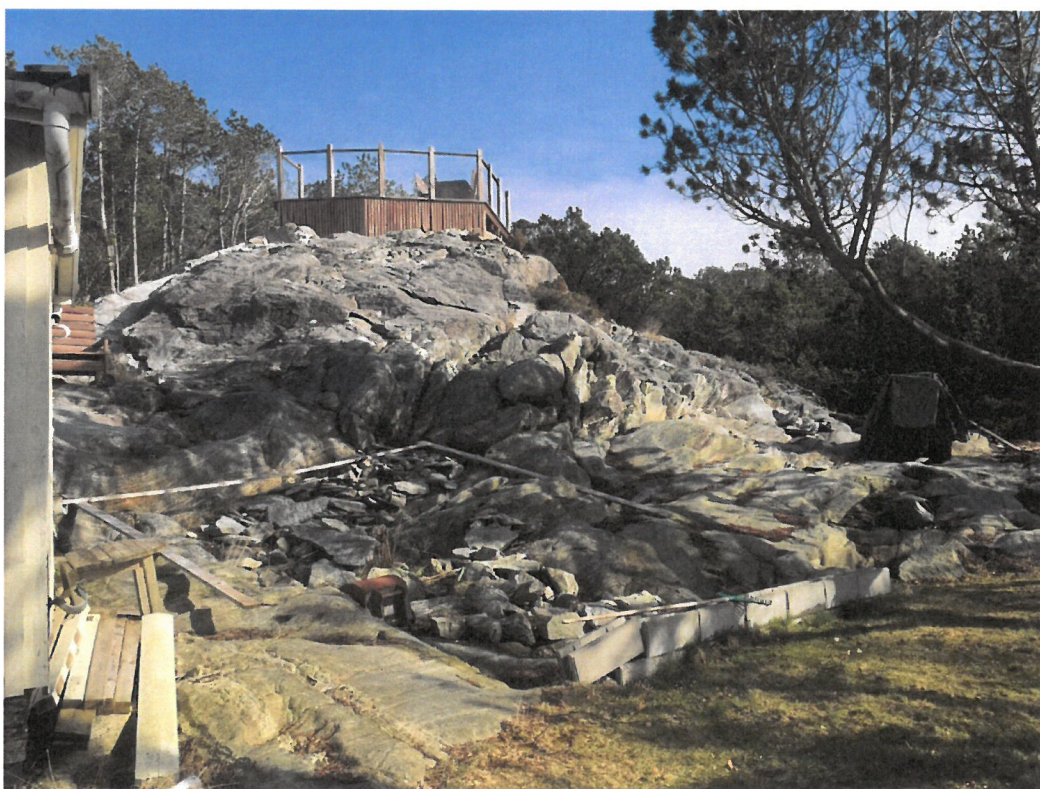
Murblokker er lagt ut for å markere hvor terrengtilpasset og nedtrappet terrasse vil gå langs berget bortover mot skogen i bakkant. Terrassen på toppen er et tiltak det nå søkes godkjenning for i ettertid