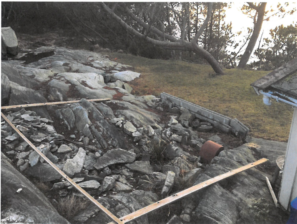
Planker lagt ut hvor nytt anneks er tenkt plassert.