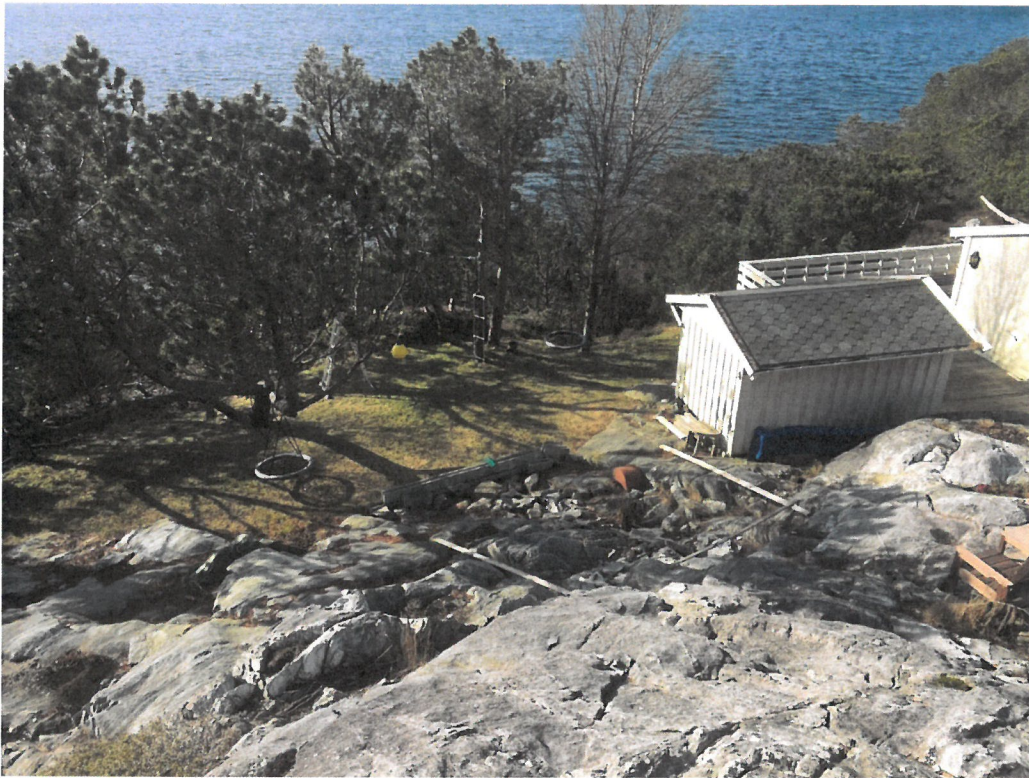
Bilde som viser dagens anneks med planker lagt ut der hvor nytt anneks er tenkt plassert.