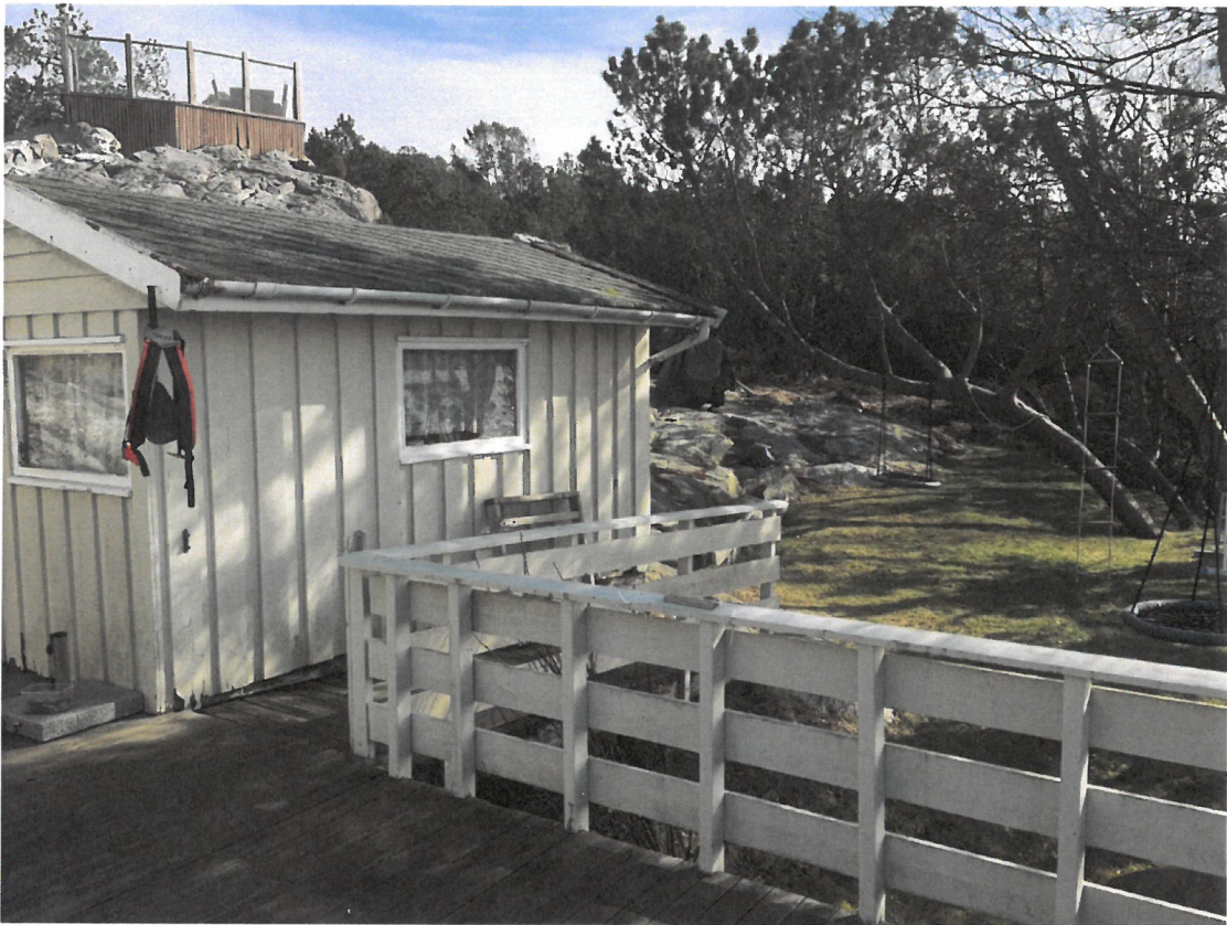
Bilder som viser dagens anneks samt terrenget som ønskes bygget inn med trappet terrasse.