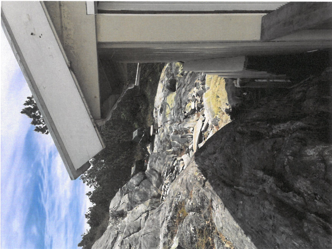
Sett fra venstre side av dagens anneks.