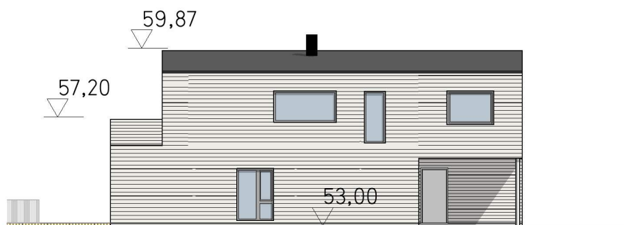
Fasade øst 1:200