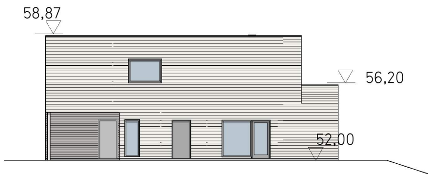
Fasade vest 1:200