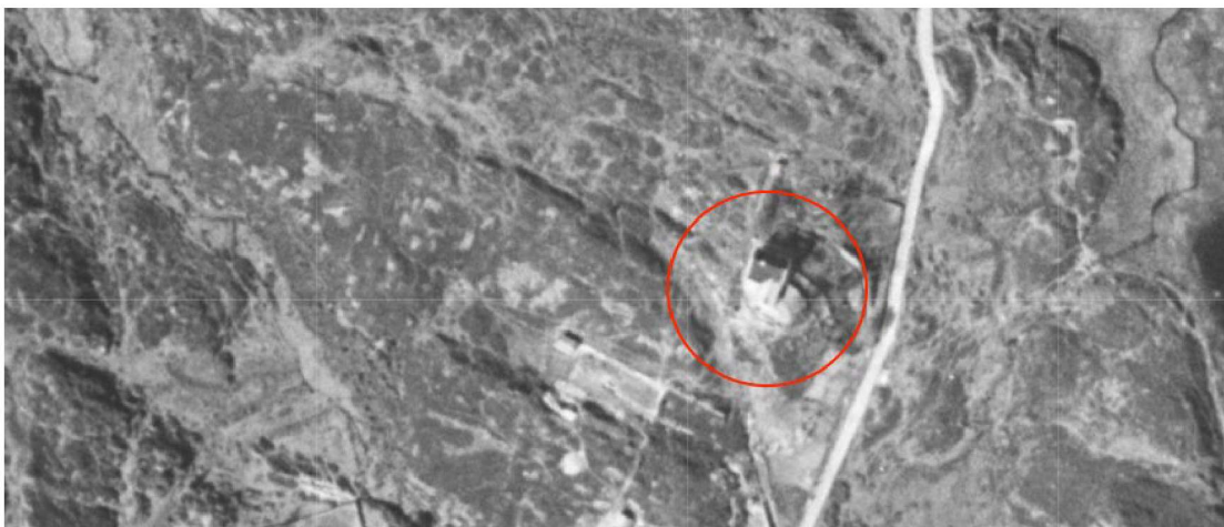
Flyfoto 1951. Hytten markert med rød ring.