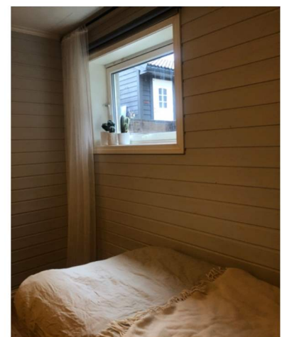
Rom mot Nord-Aust