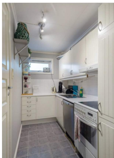
Kjøkkenen mot Nord-Aust