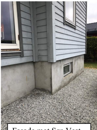
Fasade mot Sør-Vest