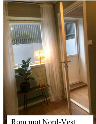
Rom mot Nord-Vest