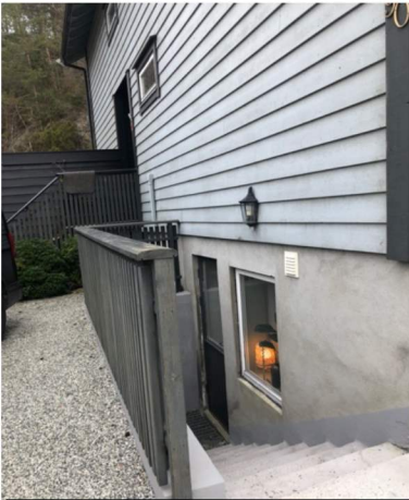
Fasade mot Nord-Vest