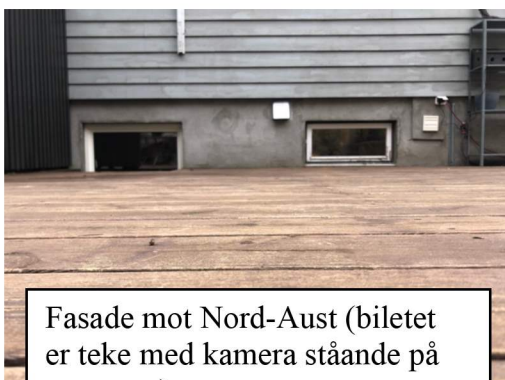
Fasade mot Nord-Aust (biletet er teke med kamera ståande på terrassen)