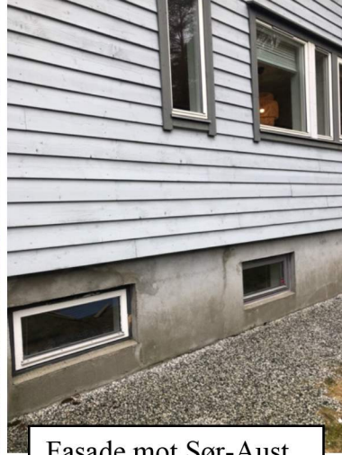
Fasade mot Sør-Aust