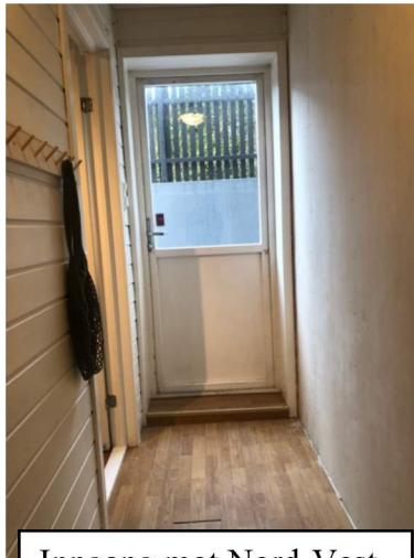
Inngang mot Nord-Vest