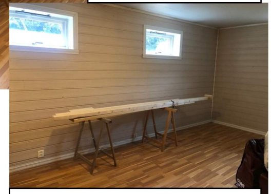
Stort rom med vegg mot Sør-Aust