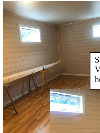
Stort rom, mot Sør-Vest (vindayge til høgre)