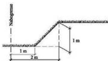
Fig. 3 viser en 1 meter høy fylling som fyllingsfoten må plasseres 2 meter fra nabogrense.

Fig. 3 og 4 viser høyde og avstand til nabogrense for fyllinger som er unntatt selv fyllingsfoten er inne på egen tomt.