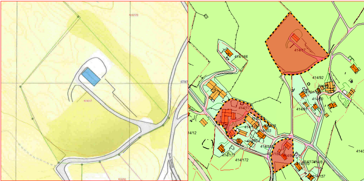
Utsnitt av situasjonsplanen