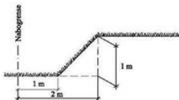
Fig. 3 viser en 1 meter høy fylling som fyllingstoppet må plasseres 2 meter fra nabogrense.

Fig. 3 og 4 viser høyde og avstand til nabogrense for fyllinger som er unntatt sel. Fyllingsfoten er inne på egen tomt.