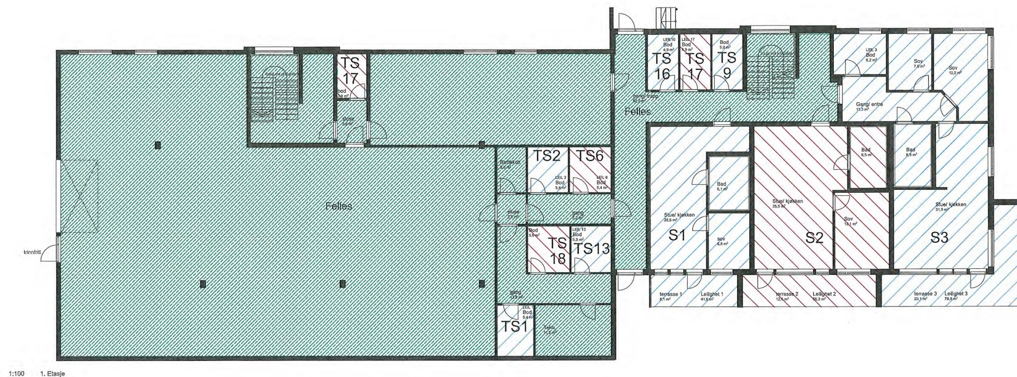
1:100 1. Etasje