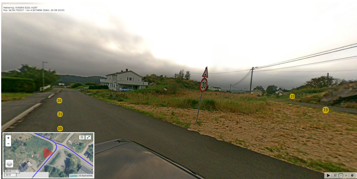
Figur 2 Vegbilde fra stedet