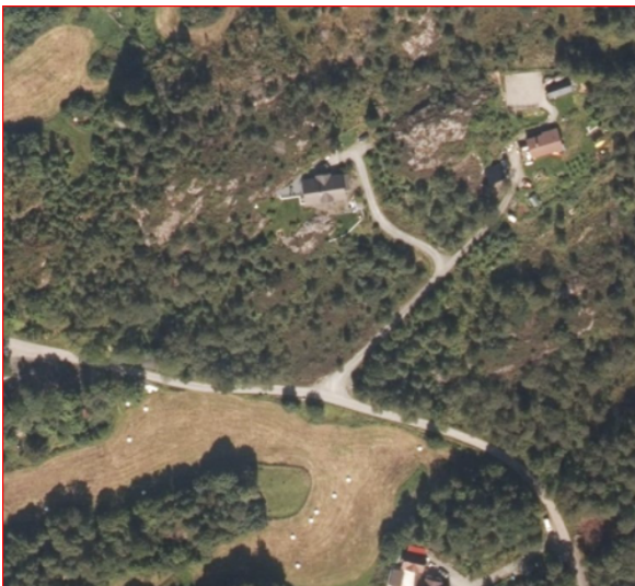
Figur 3 Ortofoto 2020