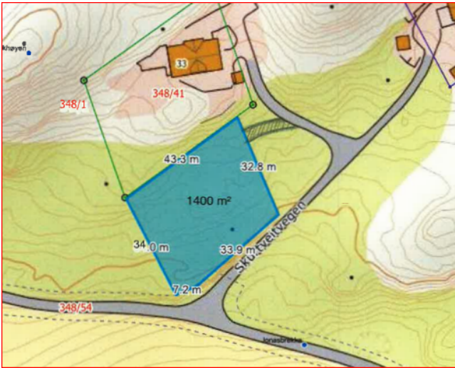
Figur 1 Frå situasjonskartet.